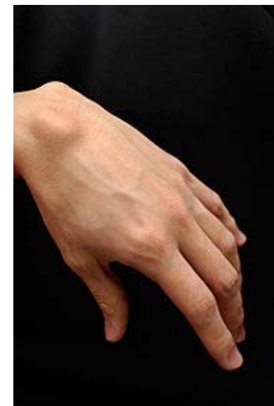
Vasakul randmel olev tsüst

Kui ganglioni tsüst on valulik, piirab aktiivsust või on lihtsalt inetu, võib selle kirurgiliselt eemaldada. Kirurgiline eemaldamine tähendab väikest sisselõiget, mis paraneb kiiresti ning jätab väikese armi.