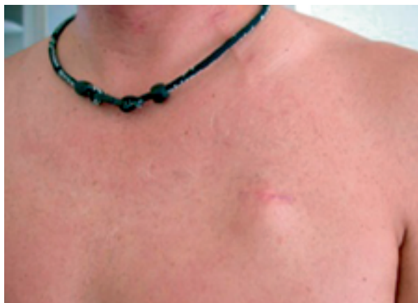
Joonis 2. Veenipordi kambri paiknemine naha all.

Paigaldatud veeniport on peaaegu märkamatu ja võimaldab elada tavapärasel elul (vt joonis 2).