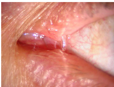
Pilt 2. Silinkoontoru pisarakanalites.

Pisarateedesse jääb ligikaudu 6–8 nädalaks silikoontoru (pilt 2), mille eemaldab arst vastuvõtu ajal, kui patsient pärast toru läbi lõikamist selle välja nuuskab.