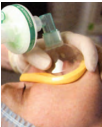
Пациент под масочным наркозом.

интравенозная регионарная анестезия – используется при небольших операциях на верхней или нижней конечности. Для проведения операции на оперируемую конечность накладывается жгут и анестетик вводится в вену оперируемой конечности. Лекарственный препарат быстро начинает оказывать свое действие, его эффект длится до тех пор, пока жгут с конечности не будет снят.